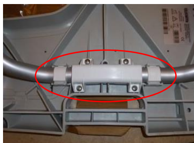
1b) Ny förstärkt benstödsinfästning på Sorrento – duschstolen ska inte bytas ut!